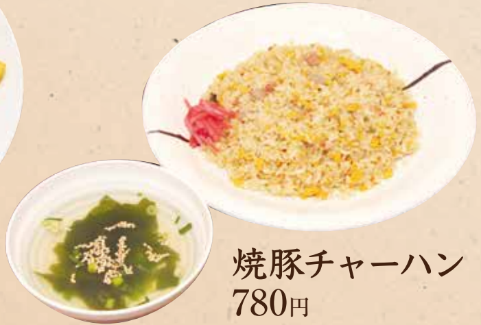
焼豚チャーハン 780円