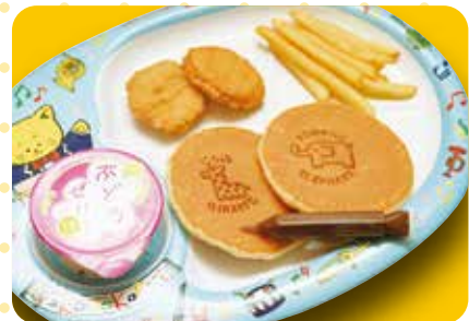
おこさまお絵かきパンケーキ 580円