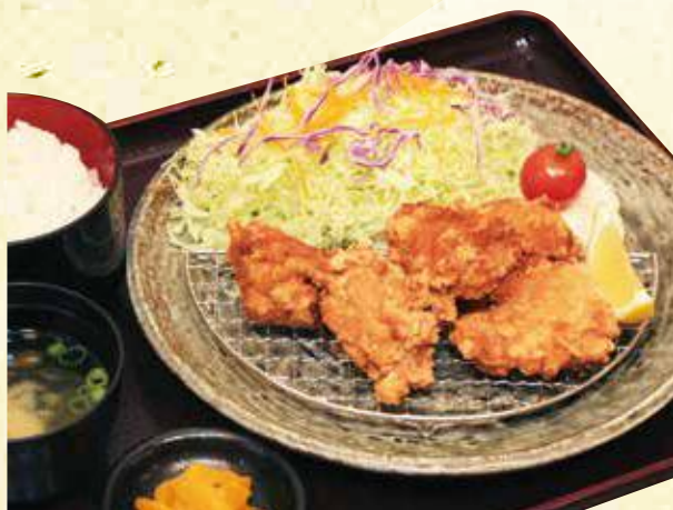
手作り若鶏の唐揚げ定食 980円