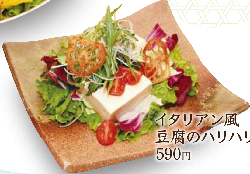
イタリアン風 豆腐のハリハリサラダ 590円