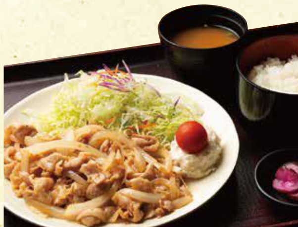
豚の生姜焼き定食 980円