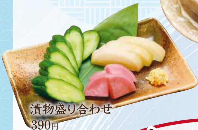
漬物盛り合わせ 390円