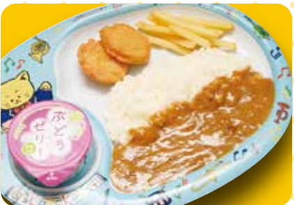
おこさまカレー 580円