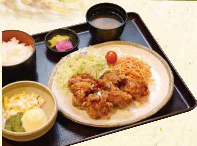
手作りチキン南蛮定食 1,280円