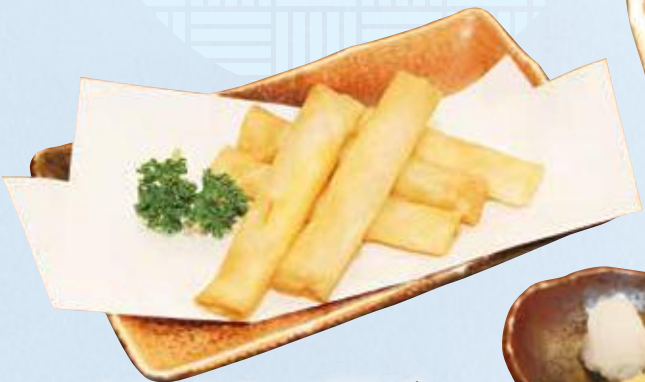
カリッとチーズ揚げ 480円