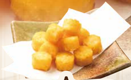
ハッシュド ポテト