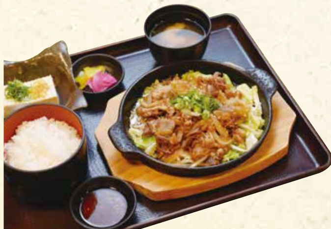
鉄板旨辛牛カルビ定食 1,280円