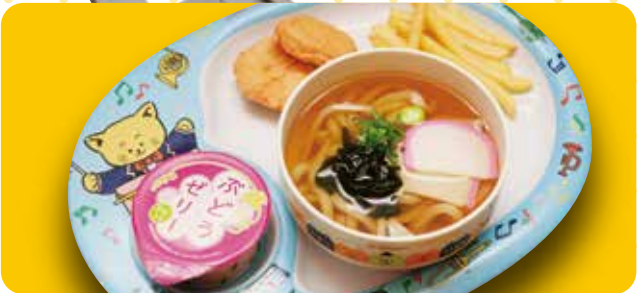
おこさまうどん 580円