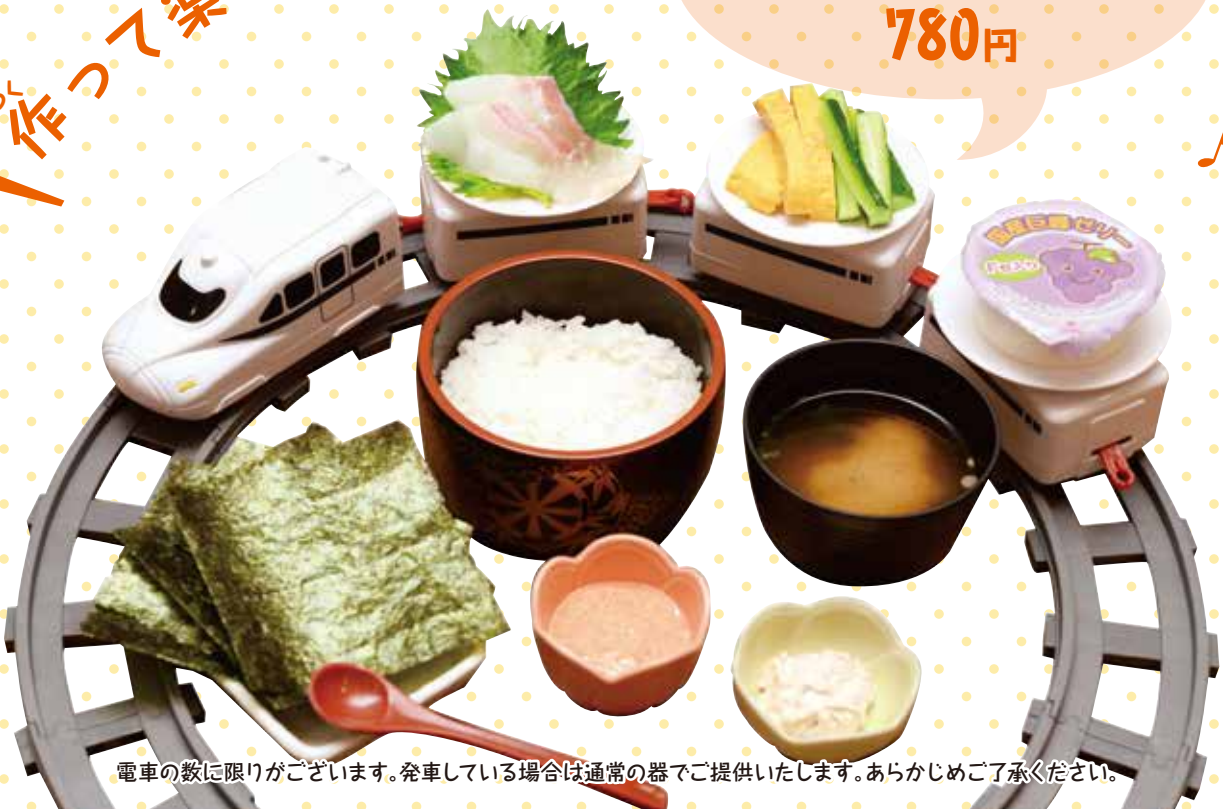
電車の数に限りがございます。発車している場合は通常の器でご提供いたします。あらかじめご了承ください。