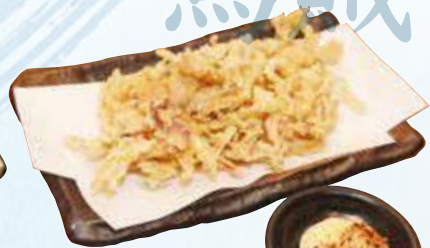
さきいかの天ぷら 480円