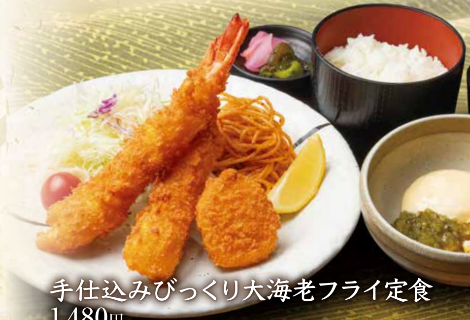
手仕込みびっくり大海老フライ定食 1,480円