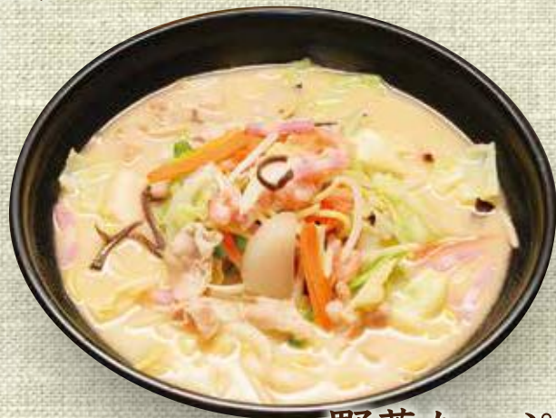
野菜たっぷり ちゃんぽん 980円