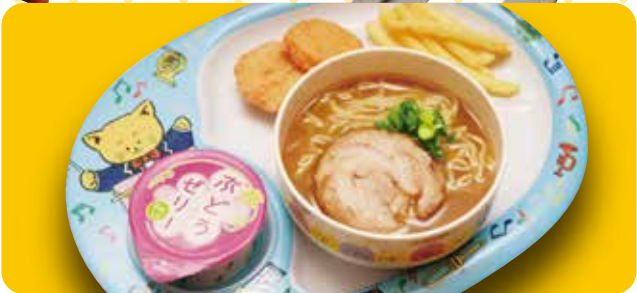
おこさまラーメン 580円