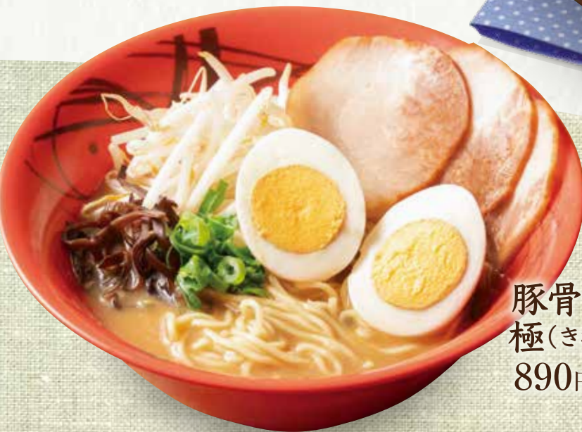
豚骨ラーメン 極(きわみ) 890円