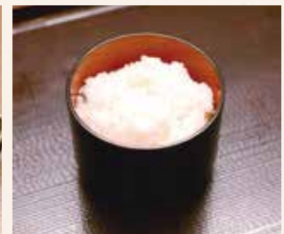
おいしいごはん 250円

※当社の米飯商品はすべて「国産米」を使用しております。※表示価格は全て税込です。