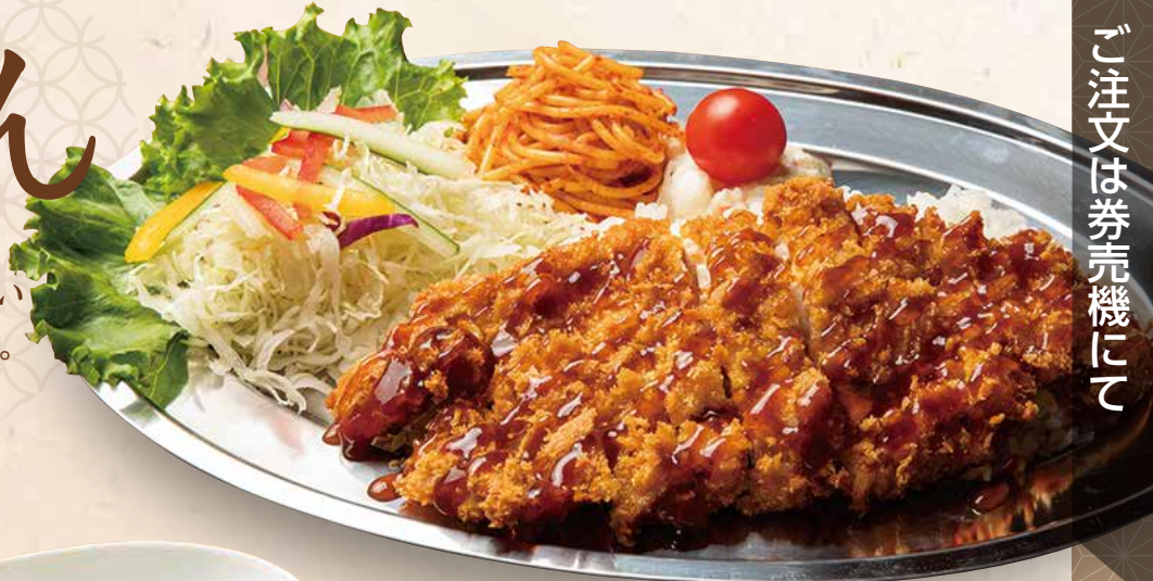
メガチキンカツライス 1,080円