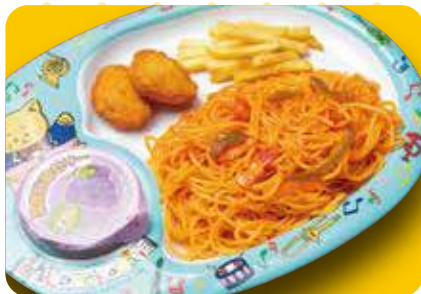
おこさまナポリタン 580円