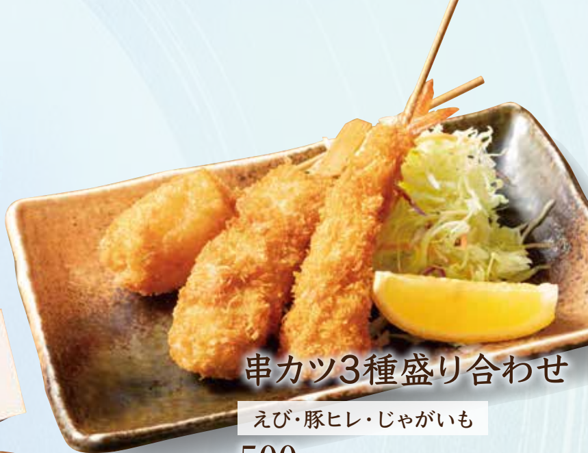
串カツ3種盛り合わせ