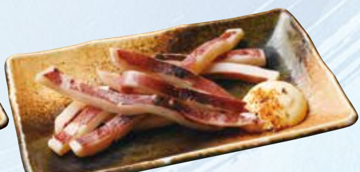
一夜干し炙りイカ 550円