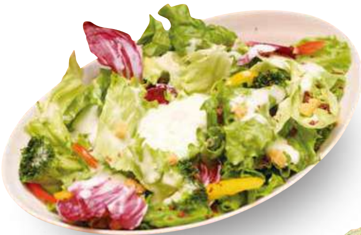
とろーり玉子の シーザーサラダ 890円