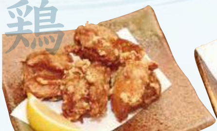
手作り若鶏の唐揚げ 600円