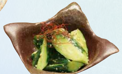
塩ごまたたききゅうり 370円