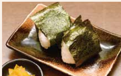
梅とゴマ昆布のおにぎり 340円