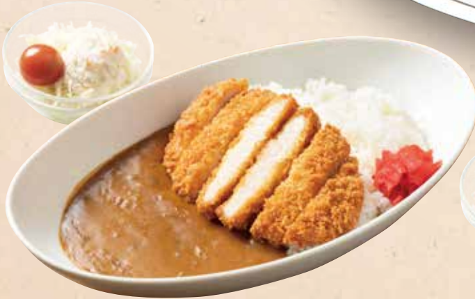
湯快のカツカレーライス 880円