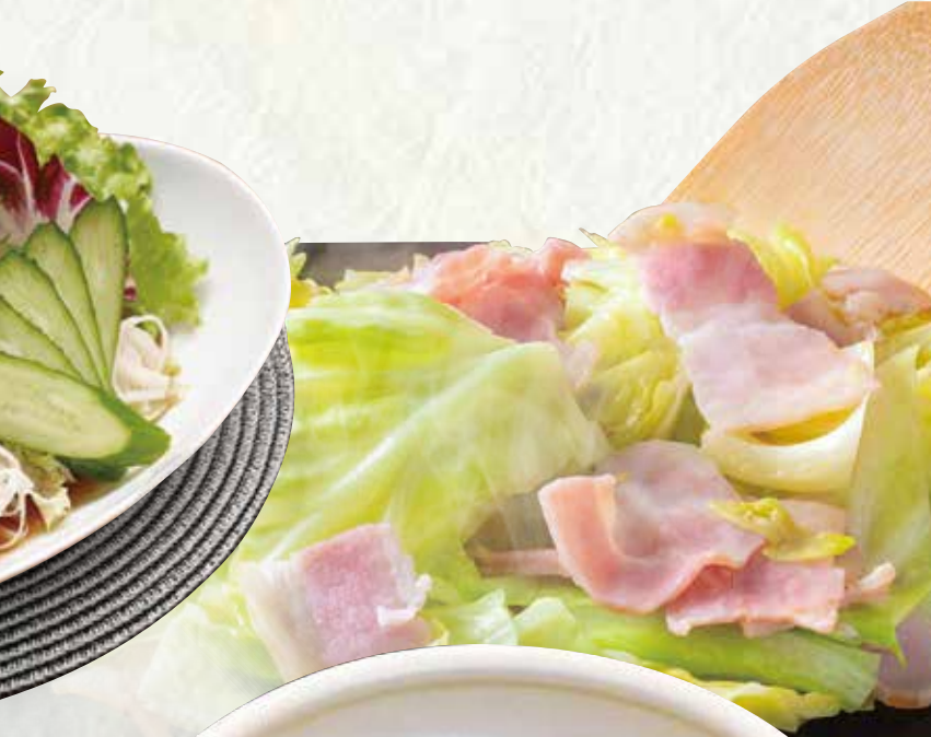
ヘルシーサラダうどん 840円