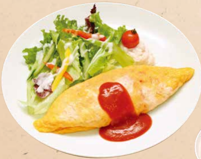
洋食屋さんのオムライス 890円